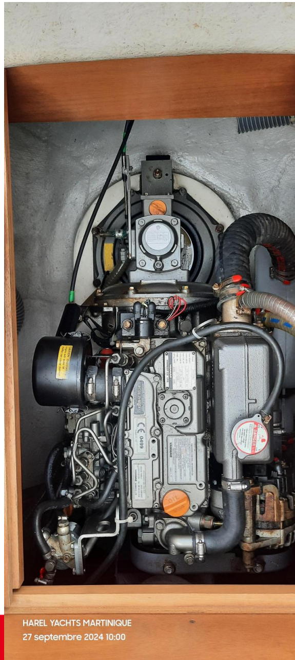
HAREL YACHTS MARTINIQUE 27 septembre 2024 10:00